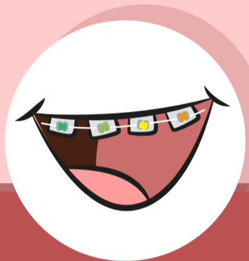
ฟันเรียงผิดปกติ