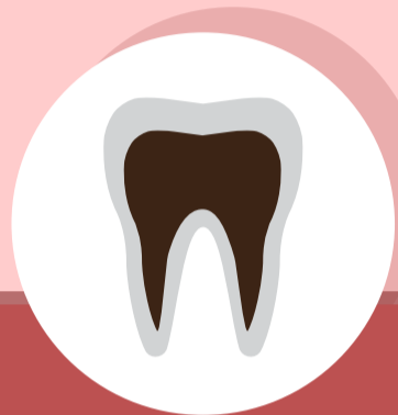
รากละลาย ฟันตาย