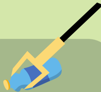
ที่คีบขยะ

ใช้อุปกรณ์เก็บมูลฝอยที่มีด้ามจับ เพื่อลดการสัมผัสกับขยะโดยตรง