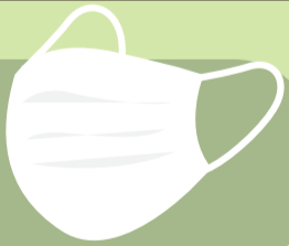
หน้ากากผ้า

ควรใส่อุปกรณ์ป้องกัน ขณะปฏิบัติงาน โดยเฉพาะ