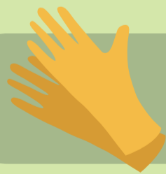
ถุงมือยางหนา

ใช้อุปกรณ์เก็บมูลฝอยที่มีด้ามจับ เพื่อลดการสัมผัสกับขยะโดยตรง